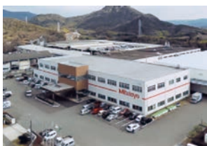
(株)ミットヨ 郷原地区工場