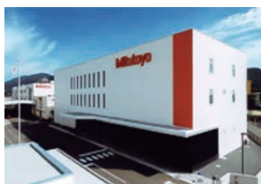
(株)ミットヨ 呉工場