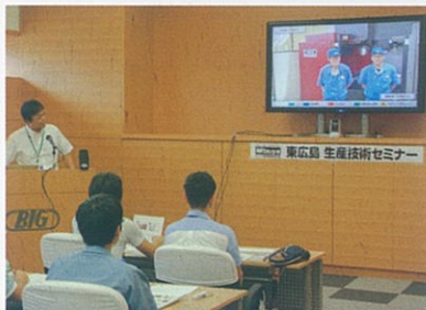
ライブ中継セミナー

※下はセミナー内容の一例です。詳しくは開催前に配布いたしますセミナー案内をご覧ください。