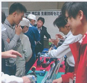
実機トライアル・相談

トレーニングキットを使用し実際に分解・組み立てを行い構造やメンテの理解を深めます。